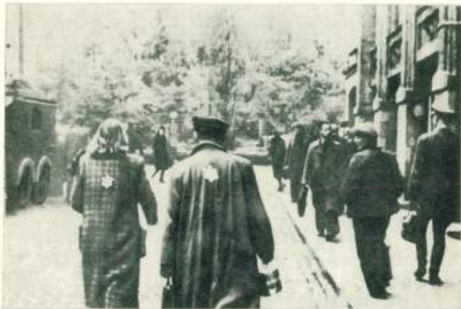
נזרות ראשונות : ליהודים אסורה החליכה במדרכות (גיטו לודי)